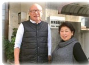
福山寮監夫妻(女子寮)

これから始まる壺溪塾の寮生活、親元を離れての生活で不安や悩みもあると思います。直営寮では、「礼儀」「コミュニケーション」「協調性」を大切に、寮生活を完全サポートしております。私たち寮監は、寮生が勉学の面でも人間的にも全塾生のお手本となってほしいという思いで温かく厳しく接していきます。皆さんと一緒に絆を深め合いながら、最終目標である大学へ送り出すお手伝いを寮監一丸となって行っていきます。皆さんの入寮を心からお待ちしております。