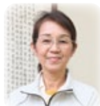
島村寮監(男子寮・女子寮)