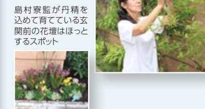
島村寮監が丹精を込めて育てている玄関前の花壇はほっとするスポット