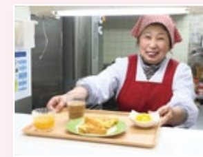
福山寮母の“フレンチトースト”や“いきなり団子”などの差し入れはとっても人気