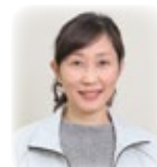
岩崎寮監補(男子寮)