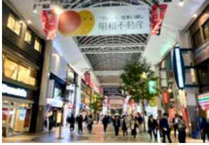
壺溪塾より市電で11分。 中心市街地「下通商店街」